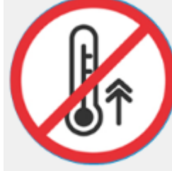
Betreten nur ohne Corona-Symptome