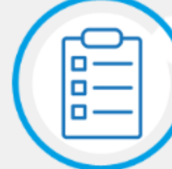
Angabe der Kontaktdaten